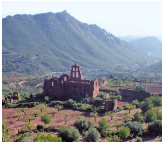
Monestir vell dels carmelites al Desert de les Palmes

La ment torna sovint en aquest lloc i a aquests fets, cada cop que sorgeix la qüestió de l'«ecologia cristiana».