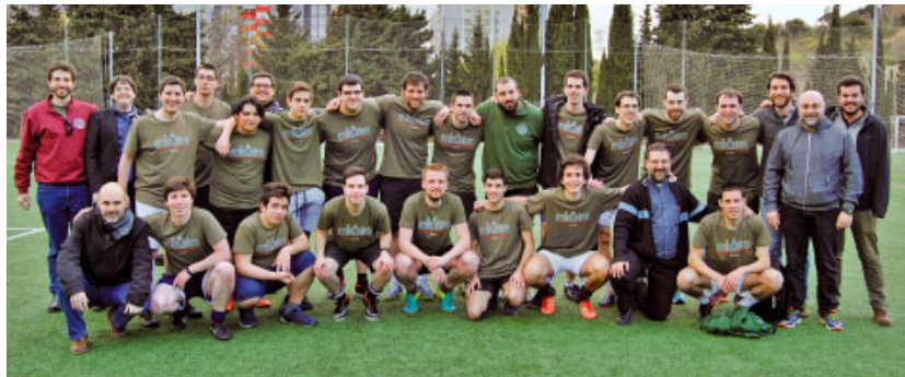
Equip del Seminari Conciliar, guanyador del torneig de futbol del dia de sant Josep

De la joia compartida a l'altar, al sopar de germanor al menjador: una manera esplèndida de concloure aquest dia de companyonia i fraternitat entre els seminaristes de Catalunya.