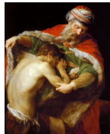
El retorn del fill pròdig (1773) de Pompeo Batoni. Museu d'Història de l'Art de Viena (Àustria)

Ens anem atansant a la Pasqua. La primera lectura fa referència a la primera Pasqua en llibertat del poble d'Israel: Llavors els israelites van celebrar la festa de Pasqua. Des d'aquell dia ja no caigué més el manà, el menjar del desert. Ara ja són a la terra promesa; ja s'ha celebrat el pas (la Pasqua) de l'esclavitud a la terra promesa.