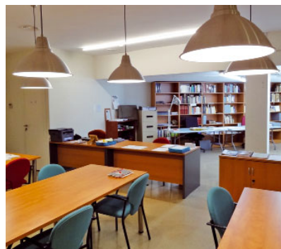
Instal·lacions de l'Arxiu Històric Diocesà

Per una altra banda, dissabte 24 de novembre tindrà lloc una trobada de formació per als docents, on conei-