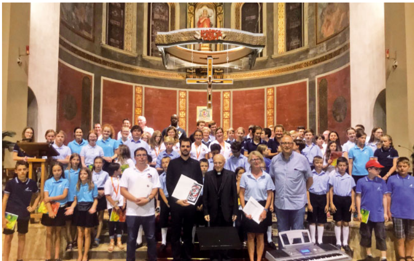
Sant Feliu de Llobregat

Diumenge 15, a la cloenda del Congrés, al final de l'eucaristia de la Sagrada Família, es va anunciar que el proper Congrés Internacional de Pueri Cantores tindrà lloc el juliol del 2022 a Florència, tot i que abans els Pueri Cantores es trobaran el desembre del 2019 a Roma per celebrar la missa de cap d'any amb el Papa.