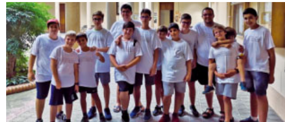
Escolans i seminaristes del Bisbat de Sant Feliu de Ll.