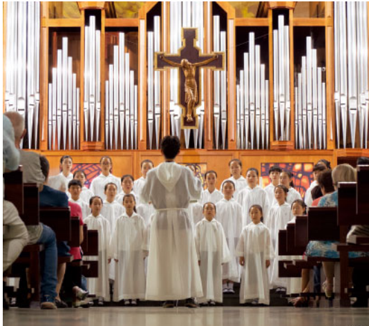
Olesa de Montserrat

La Basílica de Santa Maria de Vilafranca es va omplir de públic per escoltar els cantaires de la Catedral de Munster (Alemanya): 124 Pueri Cantores en dos cors, un de nois i un de noies, entre 10 i 19 anys, que anaven alternant peces cantades pel cor de nois, de noies i tots junts. El concert va anar precedit d'una recepció per part de l'Ajuntament al Vinseum, i una visita a la seu dels Castellers de Vilafranca. Després van sopar amb un àpat fred ofert per la parròquia i, finalment, va tenir lloc