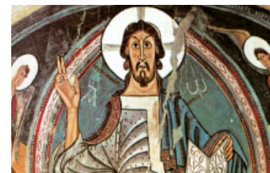
Pantocràtor de l'església de Sant Climent de Taüll, Lleida (s. XII)

«Un sol Senyor, una sola fe, un sol Baptisme, un sol Déu i Pare»