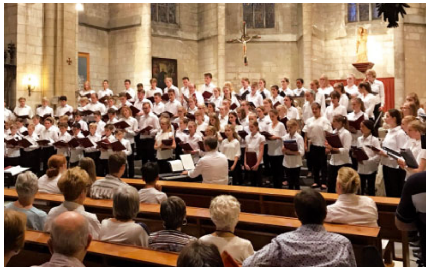
Vilafranca del Penedès