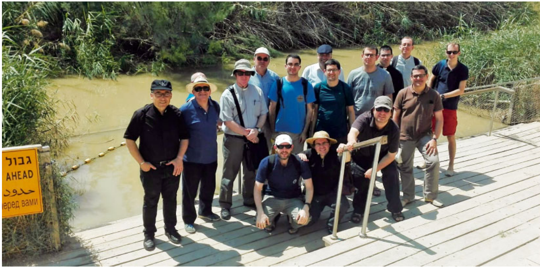
Visitant les fonts del riu Jordà

Del 20 al 28 de juny, un grup de 20 seminaristes i preveres de Catalunya, recentment ordenats, van realitzar un pelegrinatge a Terra Santa, resseguint els llocs sants més emblemàtics de la Terra de Jesús, especialment el Cenacle i el Sant Sepulcre de Jerusalem, des d'on s'expandí l'Església missionera i que anomenem l'Església Mare de Jerusalem.