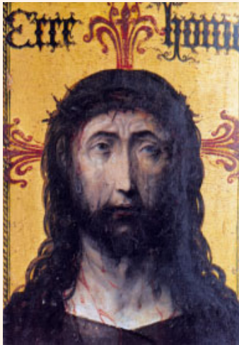
La Santa Faz. Pintura sobre taula atribuïda a Juan de Flandes (Cartoixa de Miraflores, Burgos)

En aquel tiempo, fue Jesús a su pueblo en compañía de sus discípulos. Cuando llegó el sábado, empezó a enseñar en la sinagoga; la multitud que lo oía se preguntaba asombrada: «¿De dónde saca todo eso? ¿Qué sabiduría es ésa que le han enseñado? ¿Y esos milagros de sus manos? ¿No es éste el carpintero, el hijo de María, hermano de Santiago y José y Judas y Simón? ¿Y sus hermanas no viven con nosotros aquí?» Y esto les resultaba escandaloso. Jesús les decía: «No desprecian a un profeta más que en su tierra, entre sus parientes y en su casa.» No pudo hacer allí ningún milagro, sólo curó algunos enfermos imponiéndoles las manos. Y se extrañó de su falta de fe. Y recorría los pueblos del contorno enseñando.