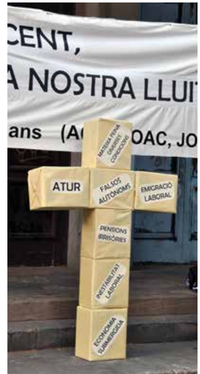
La creu de les precarietats laborals, a la pregària organitzada per la Delegació de Pastoral Obrera de Barcelona el 30 d'abril passat.

Per als cristians, aquesta situació d'injustícia és inacceptable. El missatge de Jesús és l'Amor absolut i per tant la lluita per defensar la justícia i la dignitat de la persona humana. Moltes vegades, però, tens clar en el teu cor aquest missatge i voldries aportar el teu granet de sorra però et veus impotent perquè no tens els mitjans ni la capacitat per canviar el que t'envolta. Com a cristià hem de fer com Sant Joan Baptista: ser una veu que crida al desert, que sembla que no sigui escoltada per ningú. Només que comenci a escampar-se, aquesta veu serà un ressò que provocarà un canvi en les consciències i les persones. L'esperança d'un món millor, més just i solidari no ha de morir mai, hem de lluitar amb totes les nostres forces per aconseguir aquest canvi en bé de nosaltres mateixos i de tota la nostra societat, per poder així deixar un món millor als nostres fills.