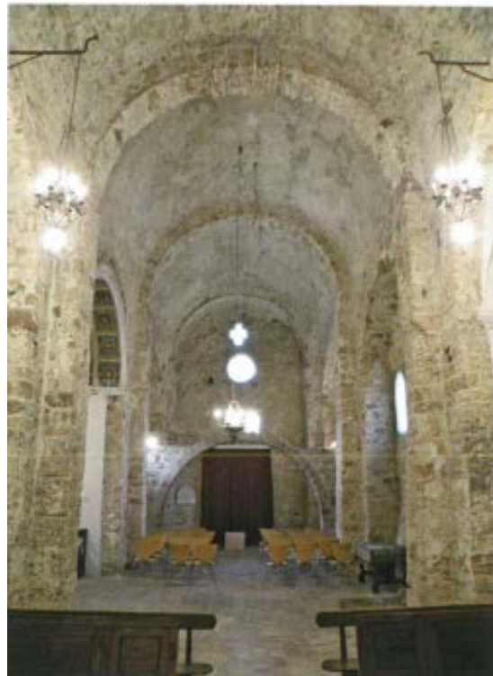
Vista de l'interior de la nau

En un posterior estadi constructiu es va afegir una volta de mig canó en la qual encara són visibles les restes de l'encanyissat que va substituir la coberta; per a poder sustentarla, es va afegir als murs laterals un sistema de suports format per arcs formers i faixons. Cada tram de nau es delimitava per un arc faixó que reforçava la volta i recolzava en pilastres alhora que contra el mur original es van construir arcs formers cecs de mig punt, també sostinguts per pilastres 4 . En aquest estadi constructiu es va edificar la porta que s'obre a la façana nord, conseqüència de la situació física de l'església en un terreny accidentat. La portada està formada per un arc de mig punt constituït per nombroses i estretes dovelles de bona talla, avui dia dins d'un gran arc escarser 5 .