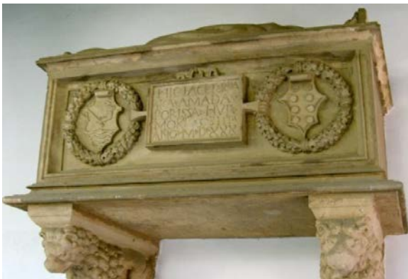
Sepulcre de Catalina Amada

A la galeria inferior es troba també el sepulcre de sor Catalina Amada. Està enlirat i sostingut per dues mènsules bessones que reproduïxen la imatge de dos lleons. L'ornamentació consta d'una làpida amb dos escuts heràldics inscrits en sendes circumferències de garlandes. Tanca el sepulcre una imatge jacent de la difunta. Sor Catalina Amada va ser priora del monestir. Morí l'any 1530.