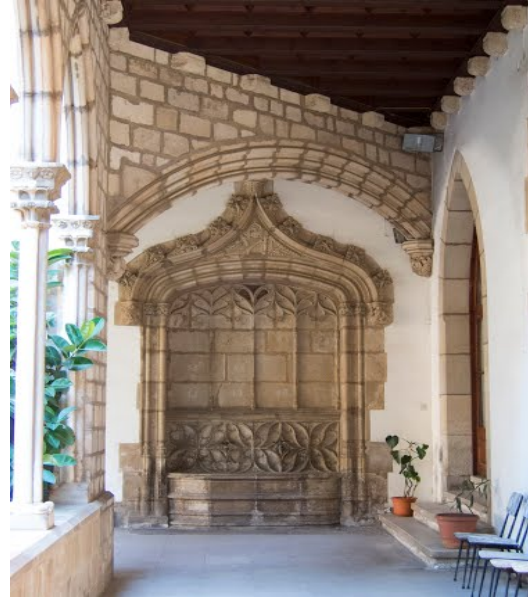
Font (segle XIV)

La font gòtica està formada per un marc de pedra a manera de columnes adossades que suporten un arc escarser, també adossat. A l'interior hi ha una decoració de motius florals en relleu. Les aixetes estan situades a la part inferior. El conjunt està coronat per una mena d'arcosoli 5 que és un arc conopial 6 , acabat en un motiu floral i que descansa sobre dos capitells adossats. L'espai entre el pinacle de l'arc conopial i la superfície de l'arc escarser està ocupat per un relleu que representa la Verge pujant les escales del temple.