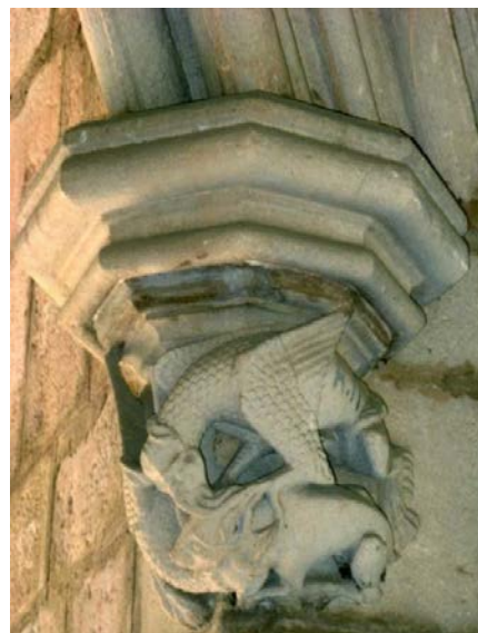
Mènsula. Lluita d'animals fantàstics

Capitell de la porta d'entrada al jardí. Es pot veure al cantó esquerre Sant Jordi lliurant la donzella i, al costat, a Adam i Eva al Paradís.