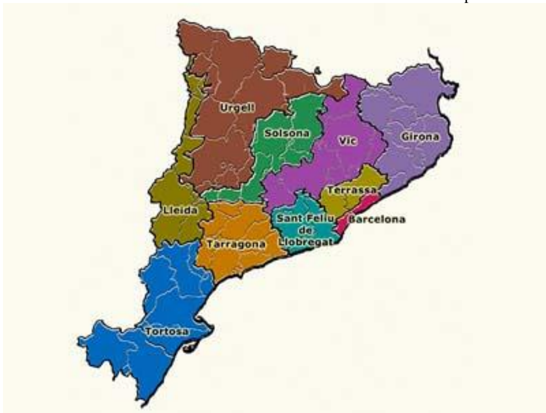
Mapa dels bisbats

Mira el mapa eclesiàstic de Catalunya i veuràs que hi ha 10 Diòcesis, totes elles conformen la CONFERÈNCIA TARRACONENSE , amb dues Províncies Eclesiàstiques, Tarragona i Barcelona.