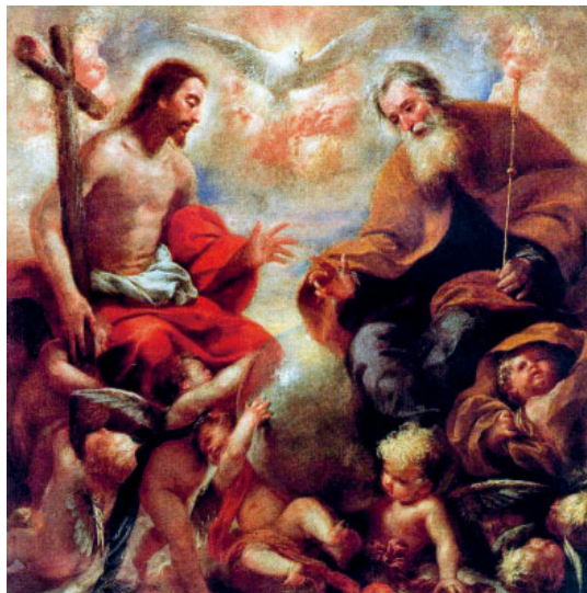
La Santíssima Trinitat, de Francesco Cairo

Tanmateix, guardo el record de la impressió que em va produir el primer contacte que vaig tenir amb el testimoni de sor Isabel de la Trinitat (Dijon, 1880-1906). Una dona de caràcter i de gran sensibilitat, apassionada i forta, intel·ligent i afectivament rica, que del seu temperament natural, segons un estudiós, «tant podria haver estat una santa com un dimoni». Però va arribar a experimentar un cim de plenitud humana en descobrir i fer motiu central de la seva oració el Déu trinitari. La seva trajectòria espiritual, com a jove creient i com a carmelita, és una autèntica cerca de la plenitud de felicitat en la relació viva amb Déu-amor. Donava per descomptat, com a bona carmelita, que havia d'assumir el dolor, com el de la malaltia que la va portar a la seva primerenca mort, però l'accent de la seva vida, estava posat abso-