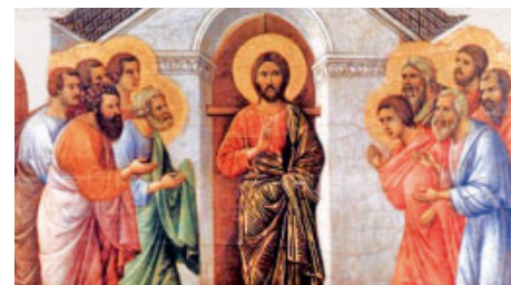
Maestà, de Duccio di Buoninsegna (s. XIV), Museo dell'Opera, Siena (Itàlia)

El llibre dels Fets dels Apòstols s'estructura sobre l'encàrrec del Ressuscitat als Apòstols: Quan l'Esperit Sant vindrà sobre vosaltres, rebreu una força que us farà testimonis meus a Jerusalem, a Judea, a Samària i fins als límits més llunyans de la terra (1,5s).