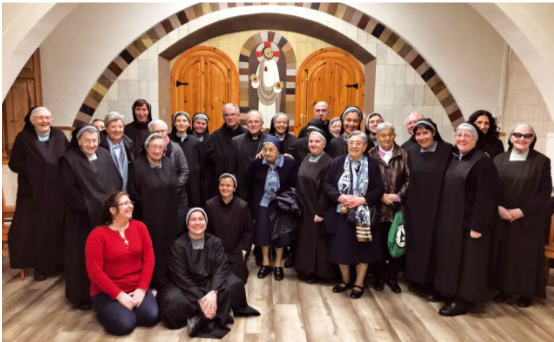
El Sr. Bisbe amb religiosos i religioses al Monestir de Sant Benet

ta Pastoral a tota la diòcesi, que va començar el mes de febrer de 2017 a l'Arxiprestat de Sant Feliu de Llobregat i que s'ha desenvolupat en el total dels 9 arxiprestats de la diòcesi.