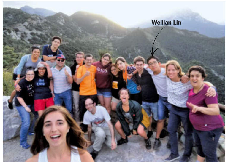
Participants a les convivències de Gisclareny 2017

El lema d'aquest any era «Pujar a la muntanya amb Jesús». Per això les activitats estaven relacionades amb la pregària personal