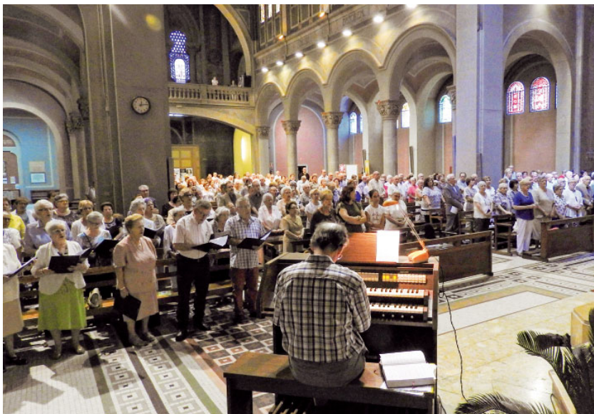
Interior del temple durant l'Eucaristia