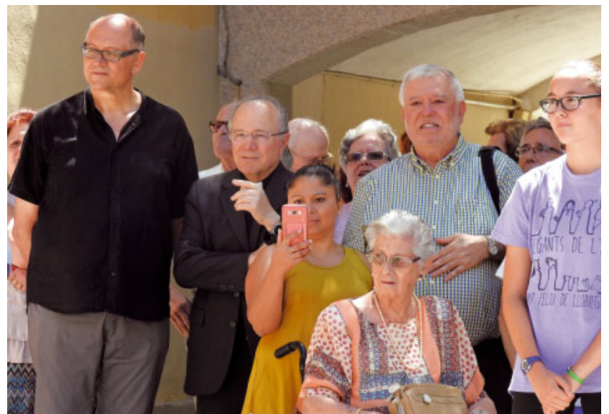
A la Plaça de la Vila, el bisbe, el rector i l'alcalde contemplen l'actuació dels gegants