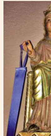
Mare de Déu d'Assumptió (Subi)

Per aquells dies, Maria se n'anà decididament a la Muntanya, a la província de Judà. Entrà a casa de Zacaries i saludà Elisabet. Tan bon punt Elisabet va sentir la salutació de Maria, el nen saltà dins les seves entranyes, i Elisabet, plena de l'Esperit Sant, cridà amb totes les seves forces: «Ets beneïda entre totes les dones i és beneït el fruit de les teves entranyes. Qui sóc jo perquè la mare del meu Senyor vingui a visitar-me? Mira: tan bon punt he sentit la teua salutació, el nen ha saltat d'entusiasme dins les meves entranyes. Feliç tu que has cregut! Allò que el Senyor t'ha fet saber, es complirà.» Maria digué: «La meua ànima magnifica el Senyor, el meu esperit celebra Déu que em salva, perquè ha mirat la petitesa de la seva serventa. Des d'ara totes les generacions em diran benaurada, perquè el Totpoderós obra en mi meravelles. El seu nom és sant, i l'amor que té als qui creuen en ell s'estén de generació en generació. Les obres del seu braç són potents: dispersa els homes de cor altiu, derroca els poderosos del soli i exalta els humils. Omple de béns els pobres, i els rics se'n tornen sense res. Ha protegit Israel, el seu servent, com ho havia promès als nostres pares; s'ha recordat del seu amor a Abraham i a la seva descendència per sempre.» Maria es quedà tres mesos amb ella, i després se'n tornà a casa seva.