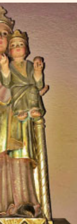
de la Fontana (rats)

Se oyó una gran voz en el cielo: «Ahora se estableció la salud y el poderío, y el reinado de nuestro Dios, y la potestad de su Cristo».