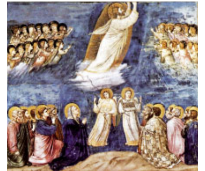
Ascensió del Senyor (1305-1306) de Giotto. Fresc de la capella dels Scrovegni. Pàdua (Itàlia)

Tot i la pregunta decebedora ( restablireu ara la reialesa d'Israel? ), confirma Jesús els deixebles en la missió: Rebreu una força —l'Esperit Sant— que us farà testimonis meus fins als límits més llunyans de la terra.