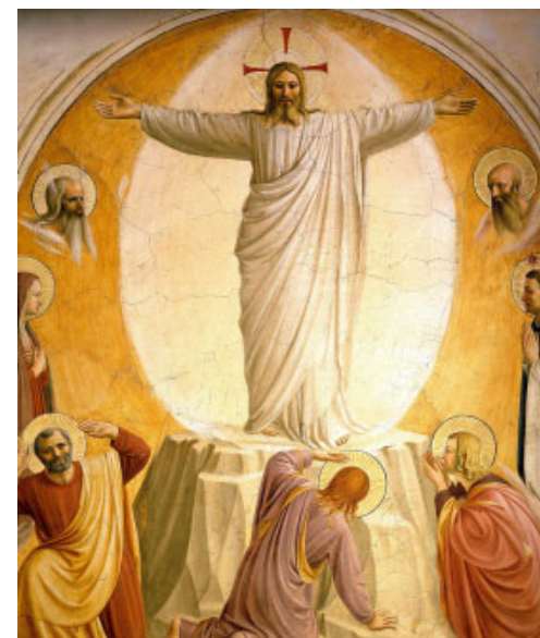
Transfiguració de Fra Angelico (1440-1442), Basilica de Sant Marc, Florència (Itàlia)

E l Senyor digué a Abram: «Vés-te'n del teu país i de la casa del teu pare, cap al país que t'indicaré». No sabem l'anterior trajectòria espiritual d'Abram però Abram se n'anà com el Senyor li digué.