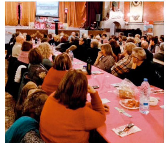
Sopar de la Fam a Vilanova i la Geltrú