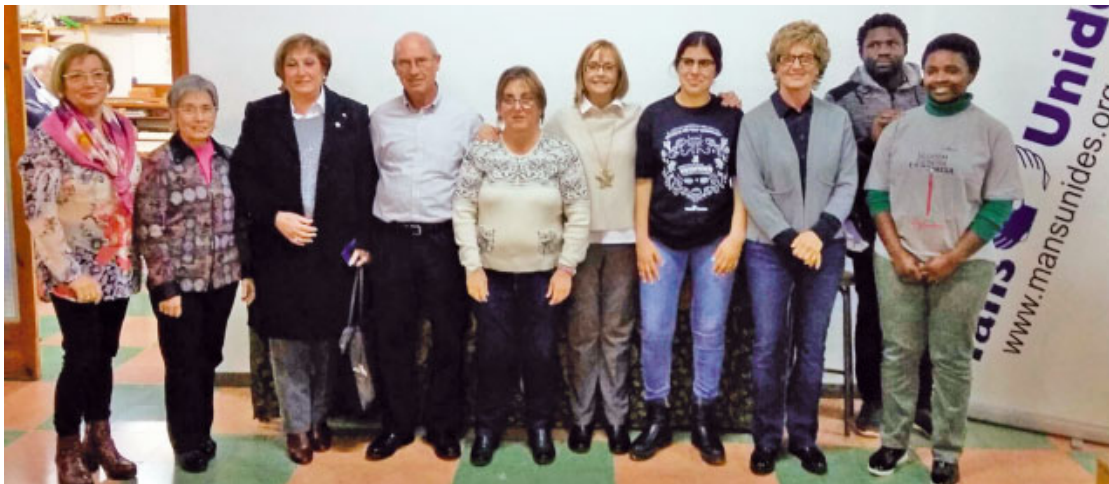
Sopar de la Fam a Sadurní d'Anoia

i complexa crisi socioambiental. Les trajectòries per a la solució requereixen una aproximació integral per a combatre la pobresa, per a retornar la dignitat als exclosos i simultàniament per a protegir la natura» (LS 139). Es pot col·laborar en qualsevol moment amb un donatiu o aportació, indicant Titular: Mans Unides Sant Feliu de Llobregat - IBAN: ES78-2100-5731-7602-0018-5880.