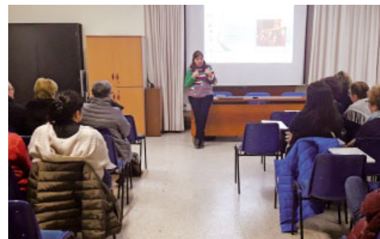
Formació de catequistes a Sant Boi

provinents de les parròquies de Sant Baldiri, Mare de Déu de Montserrat, Maria Auxiliadora i Sant Josep Obrer i acompanyats pel rector de Sant Pere Apòstol, van poder prendre consciència del seu rol, des de nous paradigmes. El berenar posterior va permetre continuar gaudint d'un bon clima de diàleg i d'intercanvi. La tarda de formació va concloure amb la celebració de l'eucaristia al temple parroquial.