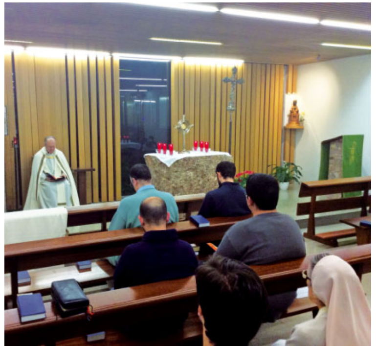
tià, un religiós, un diaca i una religiosa. Aquestes activitats seran

Simultàniament a la Cadena de Pregària, hi ha l'estada vocacional a l'Arxiprestat de Vilafranca. El proper dimecres dia 16, a les 16 h, hi ha una trobada amb catequistes sobre la cultura vocacional i dilluns 21, una taula rodona amb el títol «Viure en cristià al segle XXI», enfocada com un diàleg sobre la vocació cristiana entre un matrimoni, un jove cris-