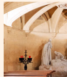
Cripta de la Basílica de Santa Maria de Vilafraanca

Per aquells dies, Maria se n'anà decididament a la Muntanya, a la província de Judà. Entrà a casa de Zacaries i salutà Elisabet. Tan bon punt Elisabet va sentir la salutació de Maria, el nen saltà dins les seves entranyes, i Elisabet, plena de l'Esperit Sant, cridà amb totes les seves forces: «Ets beneïda entre totes les dones i és beneït el fruit de les teves entranyes. Qui sóc jo perquè la mare del meu Senyor vingui a visitar-me? Mira: tan bon punt he sentit la teva salutació, el nen ha saltat d'entusiasme dins les meves entranyes. Felicitat tu que has cregut! Allò que el Senyor t'ha fet saber, es complirà.» Maria digué: «La meua ànima magnífica el Senyor, el meu esperit celebra Déu que em salva, perquè ha mirat la petitesa de la seva serventa. Des d'ara totes les generacions em diran benaurada, perquè el Totpoderós obra en mi meravelles. El seu nom és sant, i l'amor que té als qui creuen en ell s'estén de generació en generació. Les obres del seu braç són potents: dispersa els homes de cor altiu, derroca els poderosos del sol i exalta els humils. Omple de béns els pobres, i els rics se'n tornen sense res. Ha protegit Israel, el seu servent, com ho havia promès als nostres pares; s'ha recordat del seu amor a Abraham i a la seva descendència per sempre.» Maria es quedà tres mesos amb ella, i després se'n tornà a casa seva.