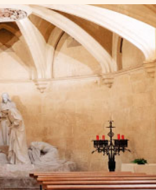
ca de Santa Maria, del Penedès