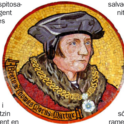
Medalló de sant Tomàs More

Responent a la segona objecció, direm que, evidentment, no demanarem que el polític faci professió de fe cristiana (ni tan sols per guanyar alguns vots), però sí que afirmem que els cristians tenim el dret i el deure de reclamar una política que respongui al que anomenem «l'humanisme cristià». Ho hem de fer, no perquè «sigui allò nostre», sinó perquè estem convençuts que Jesucrist és la plenitud de la humanitat i que l'ideal de món (treball, economia, família, societat, cos, cultura, etc.) i les grans virtuts que d'Ell deriven (justícia, solidaritat, amor, humilitat, sinceritat, servei, etc.), són la