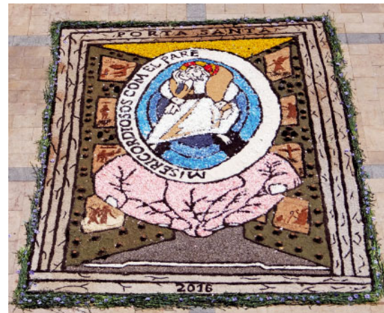
Catifa de flors en el Corpus de Sant Sadurní

pels carrers engalanats. La processó l'obren els gegants i la Moixiganga de Sitges. A l'altar muntat a la plaça del Cap de la Vila, es fa una pregària i una benedicció solemne amb la custòdia, per continuar després la processó, que acaba de nou a la parròquia. L'últim acte de les festes del Corpus a Sitges va ser la tradicional ofrena col·lectiva de clavells a la Mare de Déu del Vinyet, en el seu santuari, el dia 5 de juny.