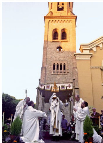
Corpus a la Catedral

Esparraguera, Abrera i Monistrol van realitzar processons. En aquesta darrera població, ja l'any passat es va recuperar l'ús de la custòdia gòtica del segle XV d'argent daurat, propietat de la parròquia de Sant Pere, que està cedida al Museu Diocesà de Barcelona, on resta exposada quan la parròquia no la requereix.