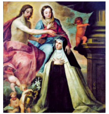
Visió de santa Maria Magdalena de Pazzi, de Pedro de Moya