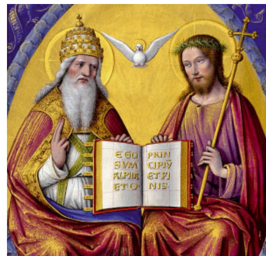
Miniatura de la Santíssima Trinitat extreta de llibre de Les grans hores d'Anna de Bretanya (1503-1508). Biblioteca Nacional de França