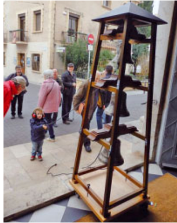
Llobregat, Cubelles, Esparreguera, Begues, Carme, Sant Climent

Van assistir-hi colles de campaners provinents de Sant Feliu de