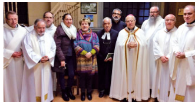
Pregària ecumènica (gener 2015)

la Catedral de Sant Feliu de Llobregat hi haurà una trobada ecumènica, presidida pel bisbe Agustí i amb representants d'altres esglésies cristianes, on pregarem perquè aquest desig fervent d'amor fratern interconfessional avanci vers la unitat visible.