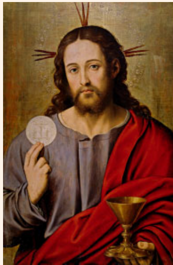
El Salvador eucarístico. Pintura de Juan de Juanes, Museo del Prado (Madrid)

Los discípulos se marcharon, llegaron a la ciudad, encontraron lo que les había dicho y prepararon la cena de Pascua. Mientras comían, Jesús tomó un pan, pronunció la bendición, lo partió y se lo dio, diciendo: «Tomad, esto es mi cuerpo.» Cogiendo una copa, pronunció la acción de gracias, se la dio, y todos bebieron. Y les dijo: «Ésta es mi sangre, sangre de la alianza, derramada por todos. Os aseguro que no volveré a beber del fruto de la vid hasta el día que beba el vino nuevo en el reino de Dios.» Después de cantar el salmo, salieron para el monte de los Olivos.