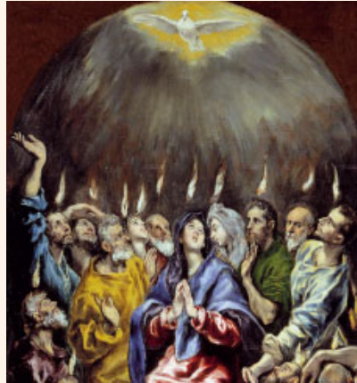
La vinguda de l'Esperit Sant. Pintura d'El Greco (fragment), Museo del Prado (Madrid)

Gloria a Dios para siempre, / goce el Señor con sus obras. / Que le sea agradable mi poema, / y yo me alegraré con el Señor. R.