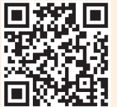
Accés al Breviari