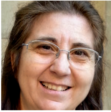
Aquesta imatge parla