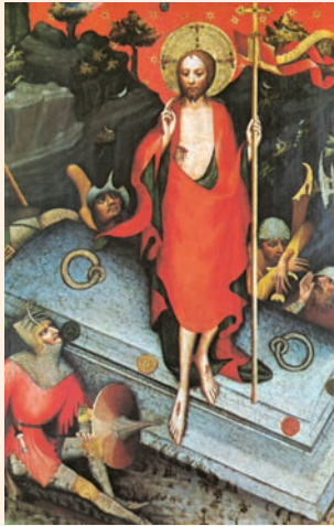
Crist ressuscitat. Retaule de Trebon (s. XIV), Galeria Nacional de Praga

La piedra que desecharon los arquitectos / es ahora la piedra angular. / Es el Señor quien lo ha hecho, / ha sido un milagro patente. R.