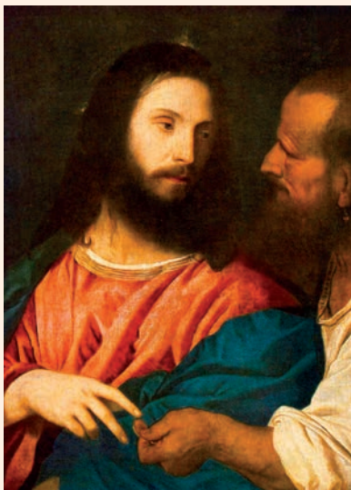
Jesús i un fariseu que li pregunta sobre el tribut al Cèsar. Pintura de Ticià, Gemäldegalerie (Dresde)

Prostraos ante el Señor en el atrio sagrado, / tiemble en su presencia la tierra toda; / decid a los pueblos: «El Señor es rey, / él gobierna a los pueblos rectamente.» R.