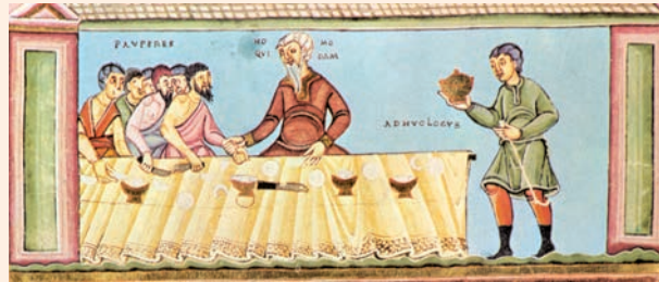
Paràbola del rei al convit de noces. Evangeliari d'Echternach (s. X), Museu Nacional de Nuremberg

En aquel tiempo, de nuevo tomó Jesús la palabra y habló en parábolas a los sumos sacerdotes y a los ancianos del pueblo: «El reino de los cielos se parece a un rey que celebraba la boda de su hijo. Mandó criados para que avisaran a los convidados a la boda, pero no quisieron ir. Volvió a mandar criados, encargándoles que les dijeran: "Tengo preparado el banquete, he matado terneros y reses cebadas, y todo está a punto. Venid a la boda." Los convidados no hicieron caso; uno se marchó a sus tierras, otro a sus negocios; los demás echaron mano a los criados y los maltrataron hasta matarlos. El rey montó en cólera, envió sus tropas, que acabaron con aquellos asesinos y prendieron fuego a la ciudad. Luego dijo a sus criados: "La boda está preparada, pero los convidados no se la merecían. Id ahora a los cruces de los caminos, y a todos los que encontréis, convidadlos a la boda." Los criados salieron a los caminos y reunieron a todos los que encontraron, malos y buenos. La sala del banquete se llenó de comensales.»