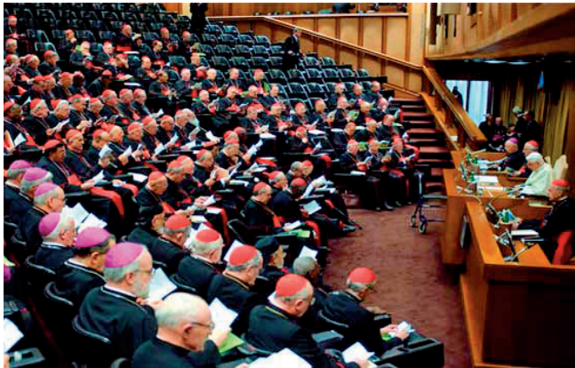
Reunió plenària del Sínode sobre la Nova Evangelització (2012)

Reunament del Sant Pare, el cardenal Martínez Sistach. El papa Francesc ha volgut fer una àmplia consulta prèvia a tota l'Església sobre els reptes de la família avui. Ara tenen la paraula els pares sinodals i el mateix papa Francesc. Que l'Esperit Sant els il·lumini.