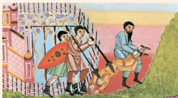
Paràbola dels vinyaters homicides. Evangeliari d'Echternach, Museu Nacional de Nüremberg

En aquel tiempo, dijo Jesús a los sumos sacerdotes y a los senadores del pueblo: «Escuchad otra paràbola: Había un propietario que plantó una viña, la rodeó con una cerca, cavó en ella un lagar, construyó la casa del guarda, la arrendó a unos labradores y se marchó de viaje. Llegado el tiempo de la vendimia, envió sus criados a los labradores, para percibir los frutos que le correspondían. Pero los labradores, agarrando a los criados, apalearon a uno, mataron a otro, y a otro lo apedrearon. Envío de nuevo otros criados, más que la primera vez, e hicieron con ellos lo mismo. Por último les mandó a su hijo, diciéndose: «Tendrán respeto a mi hijo.» Pero los labradores, al ver al hijo, se dijeron: «Este es el heredero: venid, lo matamos y nos quedamos con su herencia.» Y, agarrándolo, lo empujaron fuera de la viña y lo mataron. Y ahora, cuando vuelva el dueño de la viña, ¿qué hará con aquellos labradores?» Le contestaron: «Hará morir de mala muerte a esos malvados y arrendará la viña a otros labradores, que le entreguen los frutos a sus tiempos.» Y Jesús les dice: «¿No habéis leído nunca en la Escritura: «La piedra que desecharon los arquitectos es ahora la piedra angular. Es el Señor quien lo ha hecho, ha sido un milagro patente»? Por eso os digo que se os quitará a vosotros el reino de Dios y se dará a un pueblo que produzca sus frutos.»