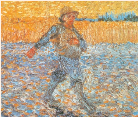
El sembrador. Pintura de Van Gogh, col·lecció particular, Madrid

Les prades es vesteixen de ramats, / les valls, cobertes de blat, / aclamen joïoses i canten. R.