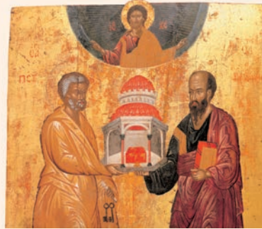
Jesucrist amb els apòstols Pere i Pau (detall). Icona de Creta (segle XVI), Museu del Louvre (París)

Jesús le respondió: «¡Dichoso tú, Simón, hijo de Jonás!, porque eso no te lo ha revelado nadie de carne y hueso, sino mi Padre que está en el cielo. Ahora te digo yo: Tú eres Pedro, y sobre esta piedra edificaré mi Iglesia, y el poder del infierno no la derrotará. Te daré las llaves del reino de los cielos; lo que ates en la tierra, quedará atado en el cielo, y lo que desates en la tierra, quedará desatado en el cielo.»