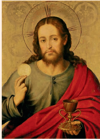
El diví Salvador. Pintura de Juan de Juanes, Museu del Prado (Madrid)

Anuncia les seves paraules als fills de Jacob, / als fills d'Israel, els seus decrets i decisions. / No ha obrat així amb cap altre poble, / no els ha fet conèixer les seves decisions. R.