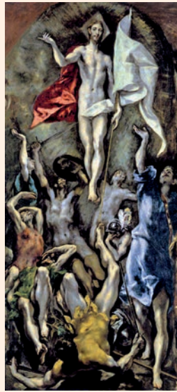
Resurrecció del Senyor. Pintura d'El Greco, Museu del Prado (Madrid)

La palabra de Dios iba cundiendo, y en Jerusalén crecía mucho el número de discípulos, incluso muchos sacerdotes aceptaban la fe.