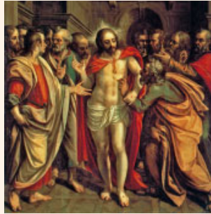
La incredulitat de Sant Tomàs. Pintura d'A. Sánchez Coello, Museu de la Catedral de Segòvia

La piedra que desecharon los arquitectos / es ahora la piedra angular. / Es el Señor quien lo ha hecho, / ha sido un milagro patente. / Este es el día en que actuó el Señor: / sea nuestra alegría y nuestro gozo. R.