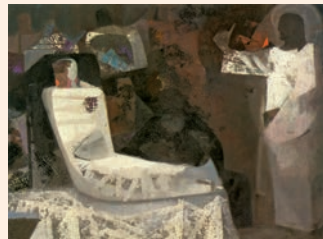
Resurrecció de Llätzer. Pintura de Marco Villalta, Museu de la Citta de Assís

Y muchos judíos que habían venido a casa de María, al ver lo que había hecho Jesús, creyeron en él.