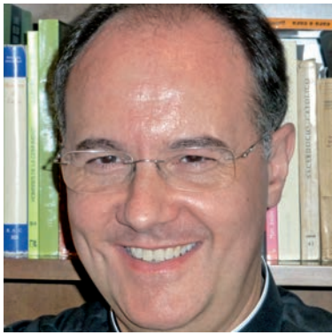
Aquesta imatge parla