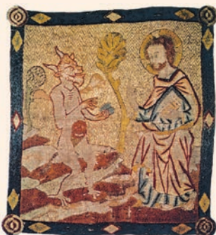
Crist és temptat pel diable al desert. Frontal brodat, Museu de la Catedral (Barcelona)

La serpiente era el más astuto de los animales del campo que el Señor Dios había hecho. Y dijo a la mujer: «¿Cómo es que os ha dicho Dios que no comáis de ningún árbol del jardín?» La mujer respondió a la serpiente: «Podemos comer los frutos de los árboles del jardín; solamente del fruto del árbol que está en mitad del jardín nos ha dicho Dios: "No comáis de él ni lo toquéis, bajo pena de muerte".» La serpiente replicó a la mujer: «No moriréis. Bien sabe Dios que cuando comáis de él se os abrirán los ojos y seréis como Dios en el conocimiento del bien y del mal.» La mujer vio que el árbol era apetitoso, atrayente y deseable, porque daba inteligencia; tomó el fruto, comió y ofreció a su marido, el cual comió. Entonces se les abrieron los ojos a los dos y se dieron cuenta de que estaban desnudos; entrelazaron hojas de higuera y se las ciñeron.