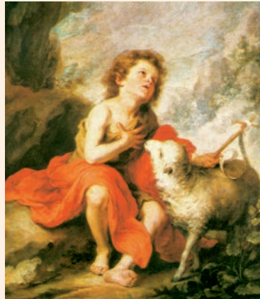
Joan Baptista, herald del Crist, l'Anyell de Déu. Pintura de Murillo, Museu del Prado (Madrid)

Anuncio amb goig la salvació / davant el poble en dia de gran festa. / No puc deixar d'anunciar-la; / ho sabeu prou, Senyor. R.