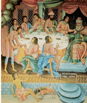
La paràbola del pobre Llätzer i el mal ric. Pintura de Bulgària

El rico insistió: "Te ruego, entonces, padre, que mandes a Lázaro a casa de mi padre, porque tengo cinco hermanos, para que, con su testimonio, evites que vengán también ellos a este lugar de tormento." Abrahán le dice: "Tienen a Moisès y a los profetas; que los escuchen". El rico contestó: "No, padre Abrahán. Pero si un muerto va a verlos, se arrepentirán." Abrahán le dijo: "Si no escuchan a Moisès y a los profetas, no harán caso ni aunque resucite un muerto."»