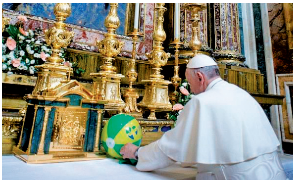
» aquesta imatge parla

Populi Romani, a la basílica de Santa Maria la Major. I en retornar del viatge, abans d'anar al Vaticà, va voler anar a fer una pregària davant d'aquesta imatge, molt venerada pels romans. A més, va tenir un gest filial i ben simpàtic de bon fill que torna a casa: va deixar sobre l'altar —com mostra la foto— una pilota de platja i una samarreta de la JMJ que havia portat de Rio de Janeiro. Com es recordarà, també va pregar davant d'aquesta imatge de Maria el passat 14 de març, l'endemà de la seva elecció.