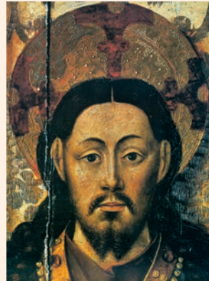
Faç de Crist, del retaule La Santa Cena , procedent de l'antiga Cartoixa de Caldecristo (Museu de la Catedral de Sogorb)

Ningún siervo puede servir a dos amos: porque o bien aborrecerá a uno y amará al otro, o bien se dedicará al primero y no hará caso del segundo. No podéis servir a Dios y al dinero.»