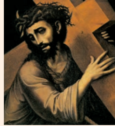
Crist portant la creu (fragment). Obra de Luis de Morales, Galeria degli Uffizi (Florència)

Obriu-me els llavis, Senyor, / i proclamaré la vostra lloança. / La víctima que ofereixo és un cor penedit; / un esperit que es penedeix, / vós, Déu meu, no el menyspreu. R.