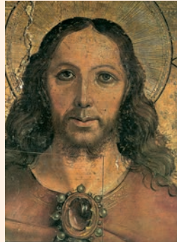
La faç de Crist, el Salvador. Pintura de Berruguete (fragment), Museu Diocesà de Palència

Derramaste en tu heredad, oh Dios, una lluvia copiosa, / aliviaste la tierra extenuada; / y tu rebaño habitó en la tierra / que tu bondad, oh Dios, preparó para los pobres. R.