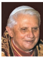
Una pregària trinitària

A questa pregària comença amb la invocació inicial al nostre Pare del cel. Sabem que és amb nosaltres, que ens porta de la mà, que ens salva. El P. Peter-Hans Kolvenbach conta en el seu llibre d'exercicis espirituals la història d'un monjo de l'Església oriental que insistia a entonar sempre el «Parenostre» al final de la darrera paraula, a fi d'acabar dignament la pregària amb la seva invocació inicial: Pare nostre.