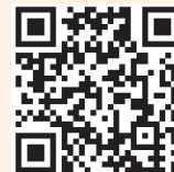
Accés al Breviari